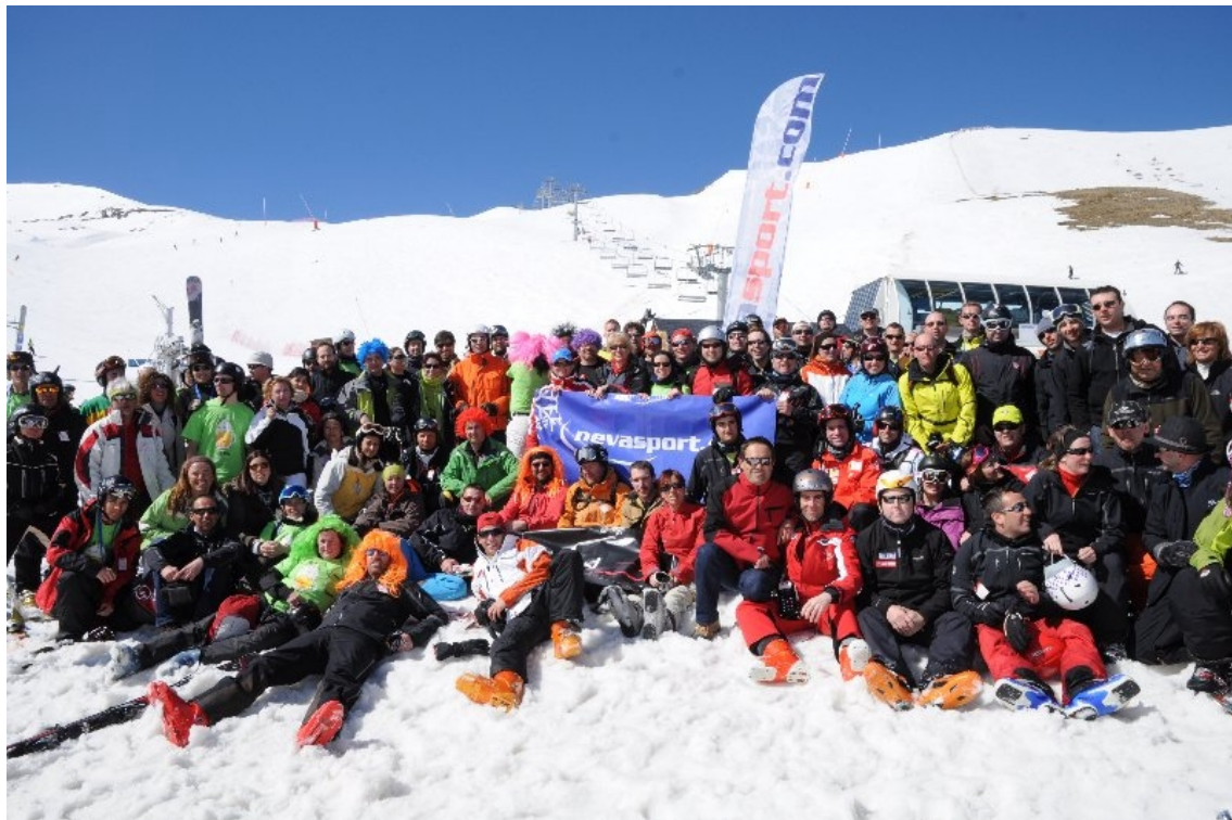
Foto Kedada 2010 Boí Taül